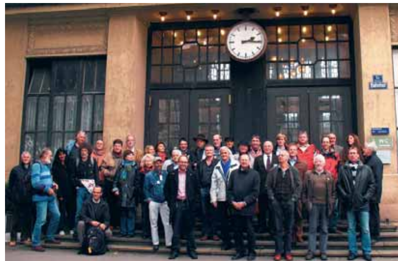
An die 50 Teilnehmer aus dem Dreiländereck haben sich am Wochenende mit der Zukunft des Lindauer Hauptbahnhofs beschäftigt.

„Im Interesse der finanzwirtschaftlich dringend erforderlichen Konsolidierung der öffentlichen Haushalte wäre es ein Stück aus dem Tollaue, die leistungsfähige, städtebaulich attraktive Substanz des jetzigen Lindauer Hauptbahnhofs nicht weiterzunutzen“, sagten die Kongressvertreter.