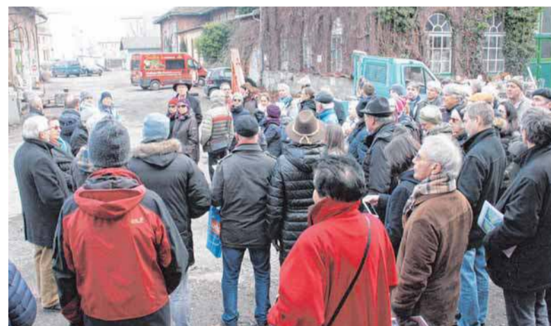
Mehr als 60 Interessierte haben sich zwei Stunden lang auf den Bahnflächen und dem Seeparkplatz umgesehen.

Auf einer Sonderseite wird die LZ im Laufe der Woche Details der Pläne für die Hintere Insel näher erläutern.